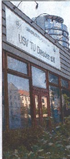
Variante World Trade Center