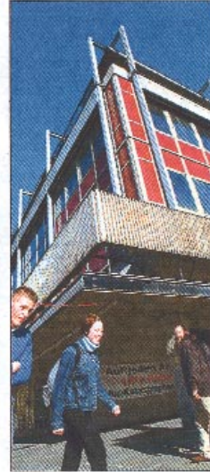
Variante Postplatz, „Presswürfel“